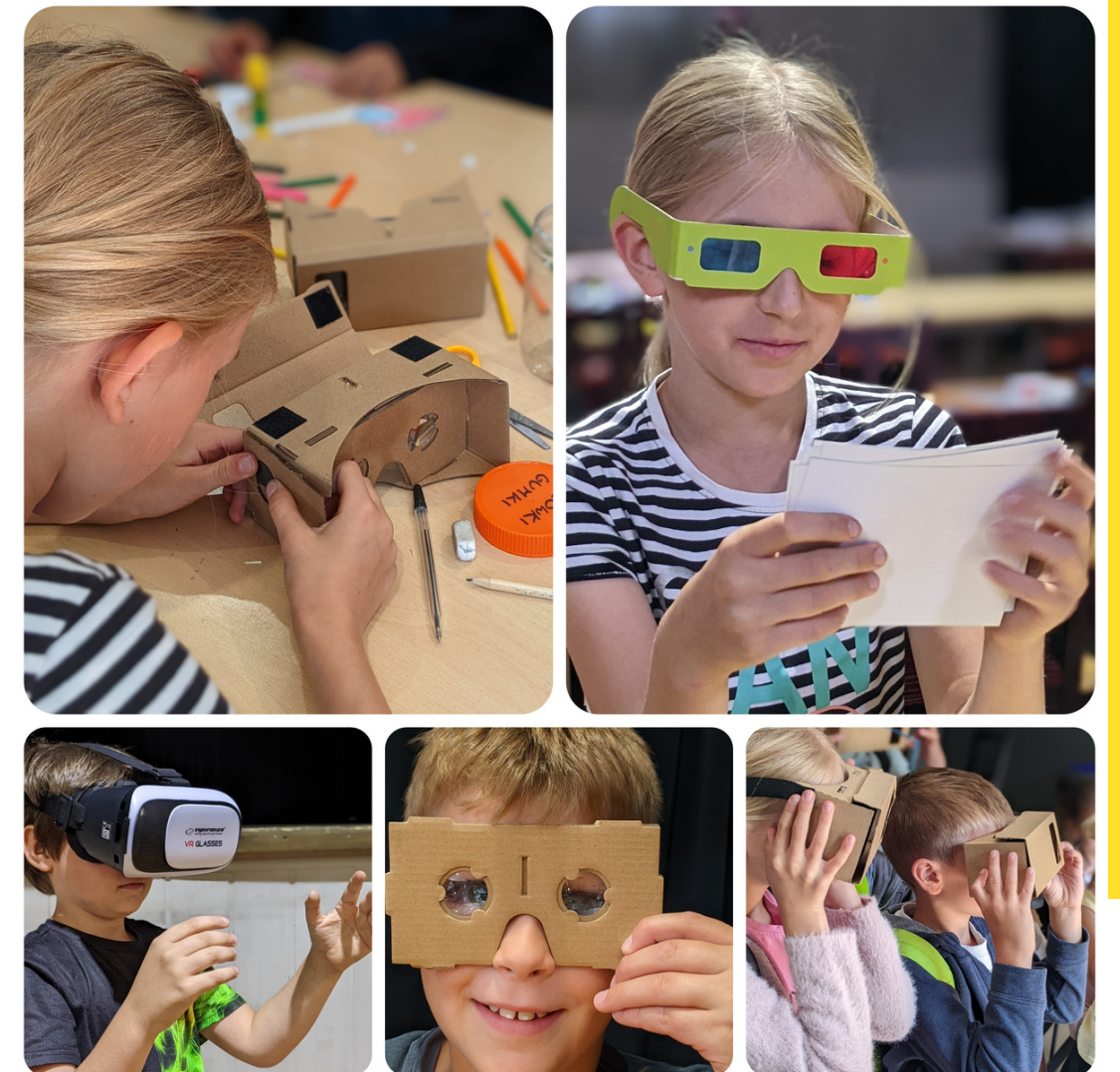
zdjęcie z warsztatów "Wirtualna rzeczywistość" Produkcja: Fundacja KinoSzkoła

Daliland , reż. Mary Harron, USA/ Francja/ Wielka Brytania 2022, 104 min.