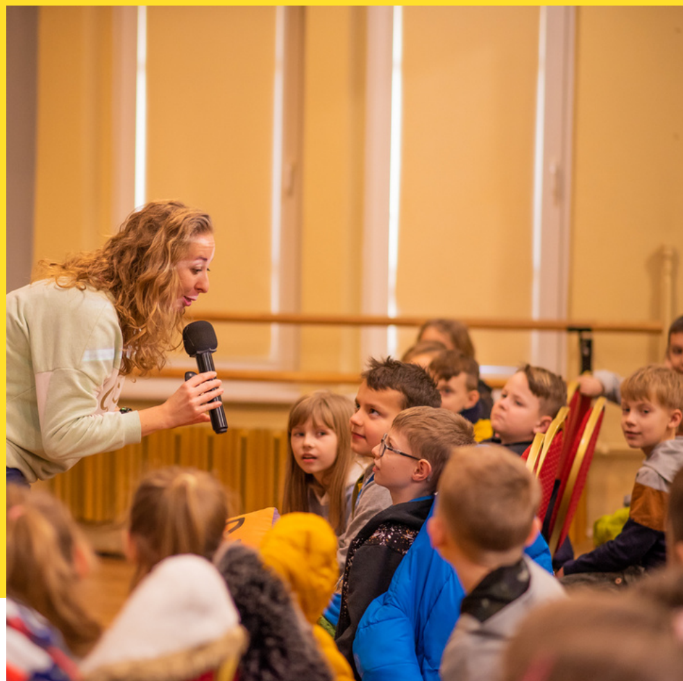
zdjęcie z zajęć KinoPrzedszkola. Produkcja: Fundacja KinoSzkoła

Niebezpieczni dżentelmeni , reż. Maciej Kawalski, Polska 2022, 107 min.