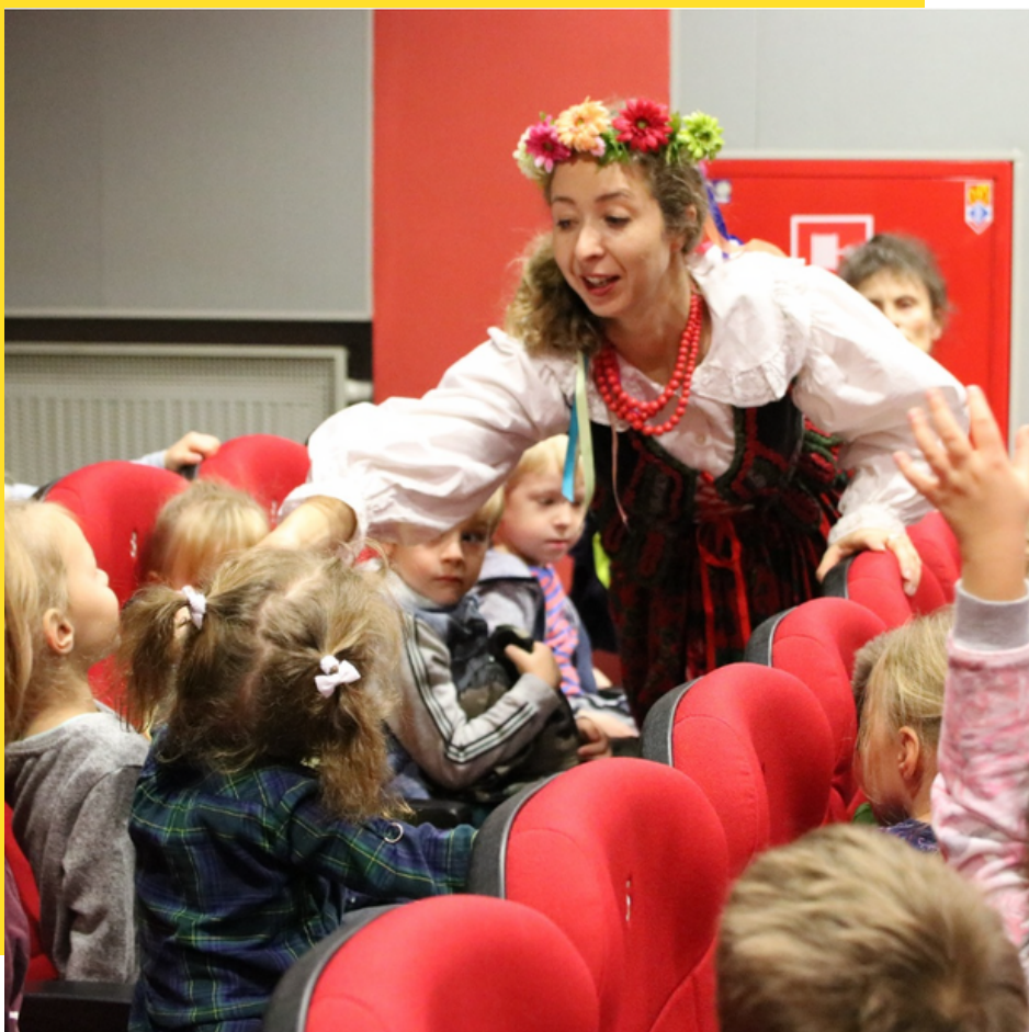
zdjęcie z zajęć KinoPrzedszkola. Produkcja: Fundacja KinoSzkoła

Brigitte Bardot Cudowna , reż. Lech Majewski, Polska 2021, 122 min.