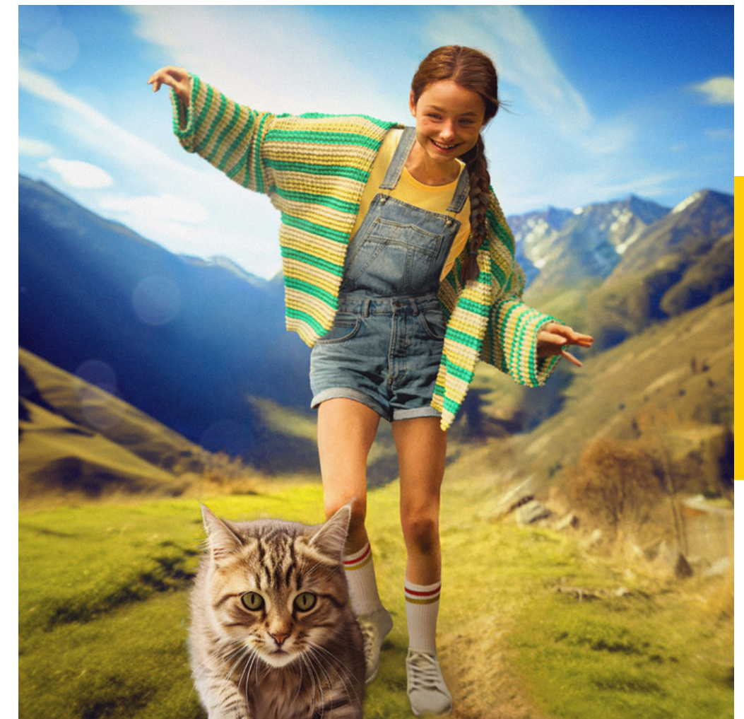
zdjęcie z filmu "Mru i ja", dystrybutor: M2Films

Simona , reż. Natalia Koryncka-Gruz, Polska 2022, 91 min.