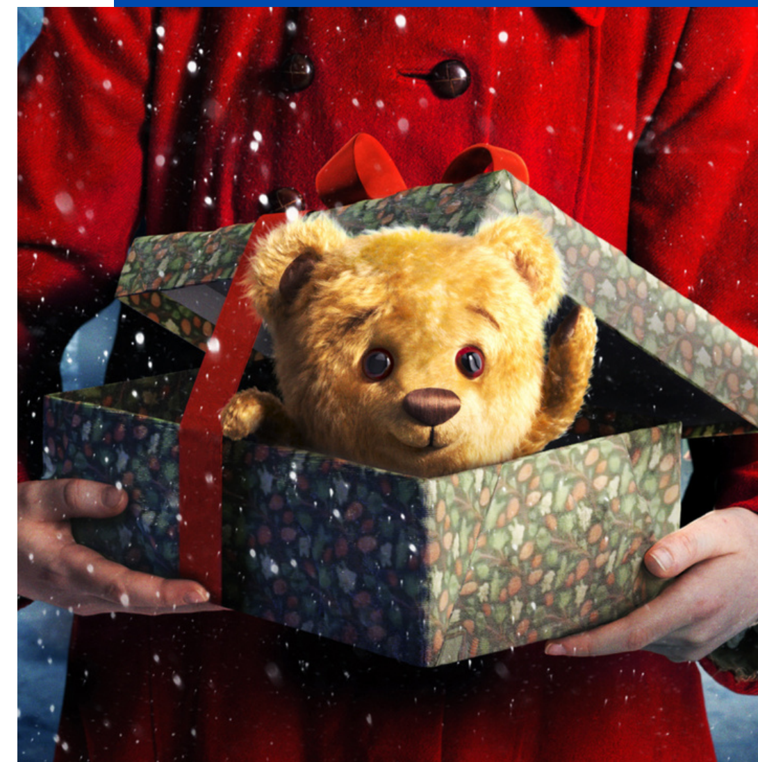
kadr z filmu "Świąteczna niespodzianka", dystrybutor: VIVARTO