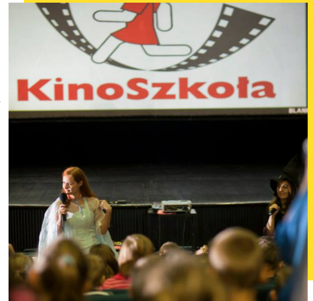
prelekcja dla klas 1-3 Produkcja: Fundacja KinoSzkola

Kochanica króla Jeanne du Barry , reż. Maïwenn, Francja 2023, 113 min.