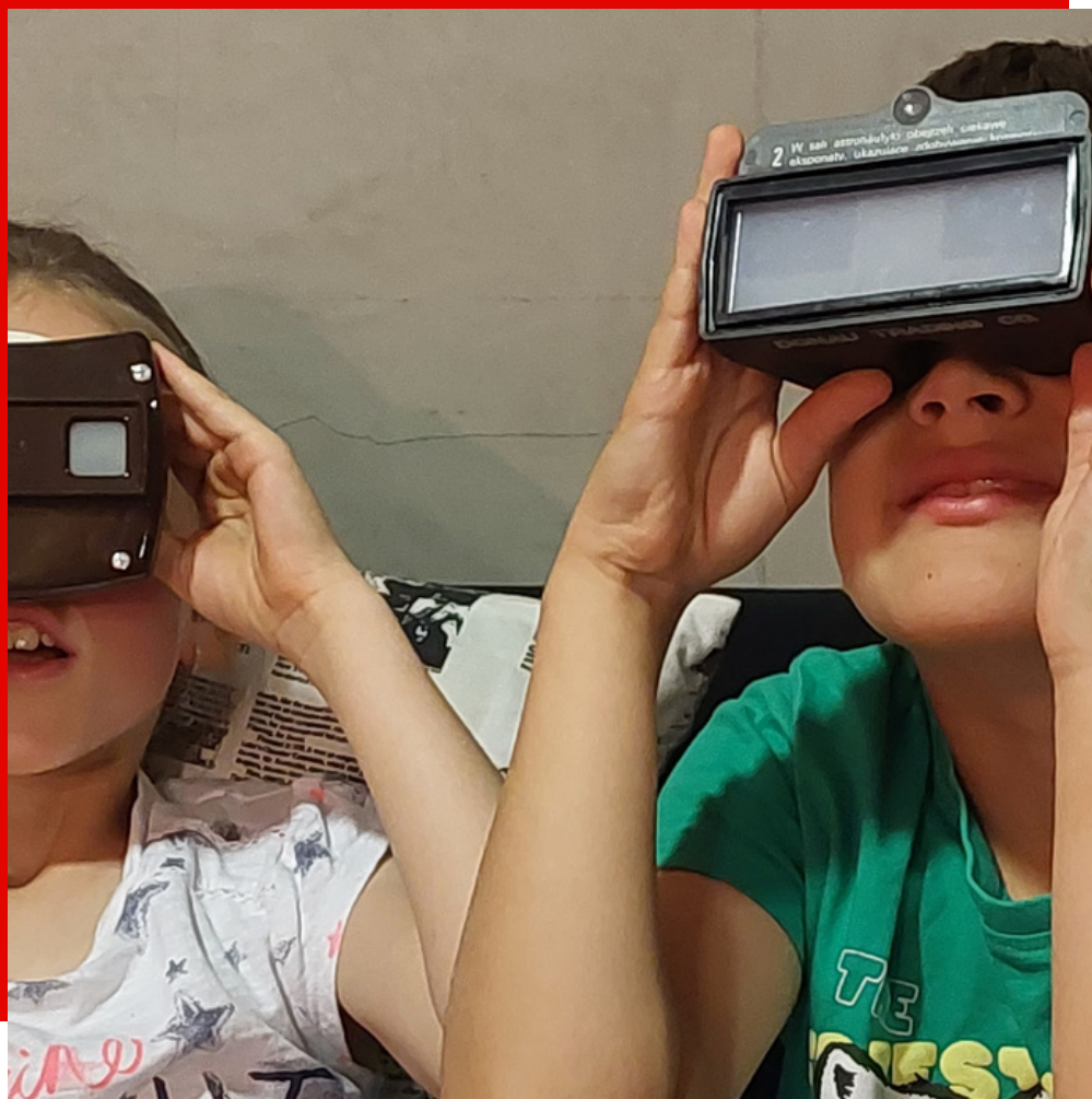
zdjęcie z zajęć warsztatowych pt. "Prekinematografia - zabawki optyczne". Produkcja: Fundacja KinoSzkoła